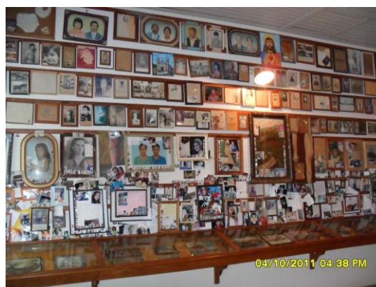
Imagens 1 e 2. A esquerda, sala de milagres de Chalma, México; à direita, Matosinhos, Brasil.