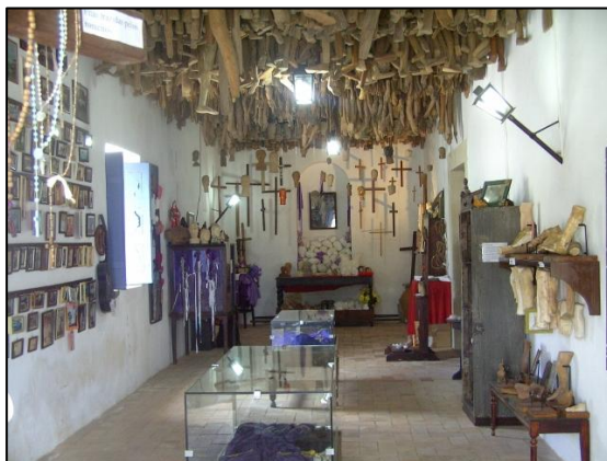
Imagem 6 – sala de milagres do Convento do Carmo, São Cristóvão, Sergipe, Brasil.

forma investigativa se aflora a cada momento em que um tipo mais hermético é catalogado, como placas de automóveis, roupas, mechas de cabelo, aparelhos ortopédicos, computadores etc, com mostra a imagem 6 a seguir: