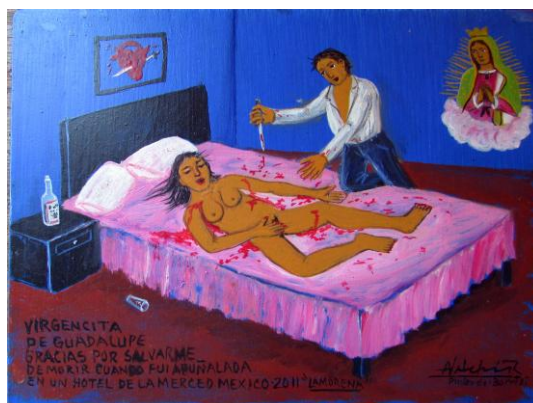
VIRGENCITA DE GUADALUPE GRACIAS POR SALVARME DE MORIR CUANDO FUI APUÑALADA EN HOTEL DE LA MERCED. MEXICO 2011. “LA MORENA”

Imagens 3 e 4. À esquerda, ex-voto setecentista de Matosinhos, Brasil; à direita, ex-voto transgressor, do século XX