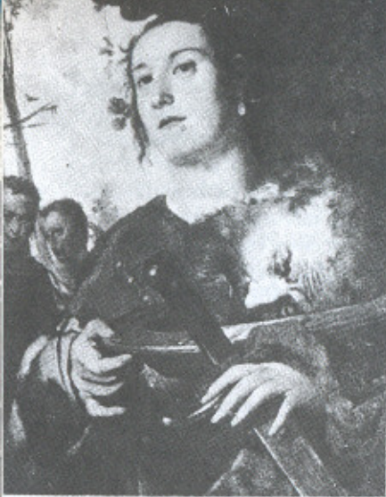
3. Francesco Maffei. Judite . Faenza, Pinacoteca