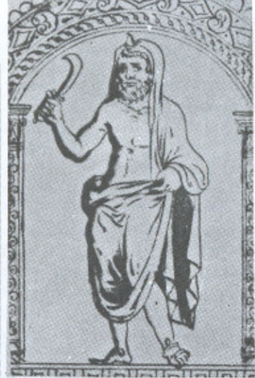
12. Saturno. Da Cronografia de 354 (Cópia da Renascença), Roma, Biblioteca do Vaticano, Cod. Barb. lat. 2154, fº 8.