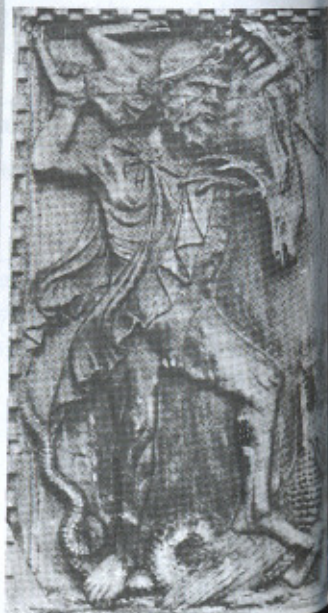
6. Alegoria da Sabedoria. São Marcos de Veneza, século XIII.

profundamente, pelos valores intelectuais e poéticos da literatura clássica. Mas é significativo que, precisamente no auge do período medieval (séculos XIII e XIV), os motivos clássicos não fossem usados para a representação de temas clássicos, enquanto que, inversamente, temas clássicos não fossem expressos por motivos clássicos.