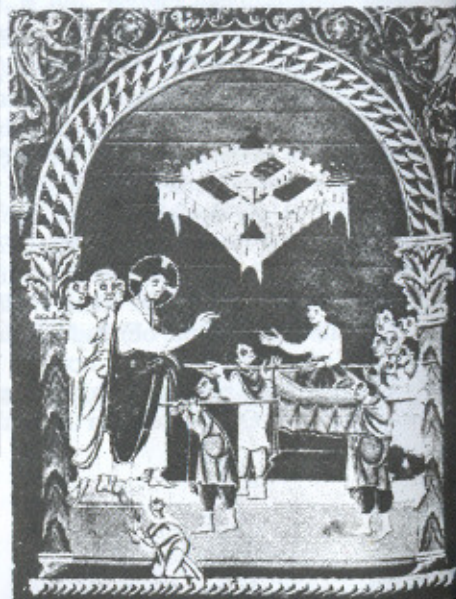
2. Cristo ressuscitando o moço de Nain . Staatsbibliothek, Cim. 58, f.º 155v., ca. 1000.