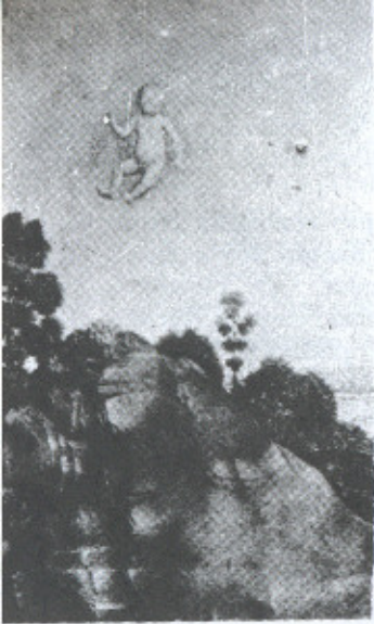
1. Roger van der Weyden. A visão dos três Reis Magos (detalhe). Berlim, Kaiser Friedrich Museum.