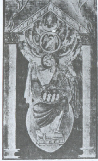
9. São João Evangelista . Roma, Biblioteca do Vaticano, Cod. Barb. lat. 711, f.º 32, ca. 1000.