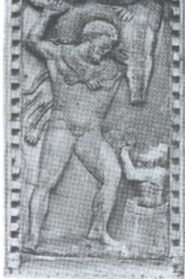
5. Hércules carregando o javali de Erimanto. Veneza, São Marcos, século III (?).