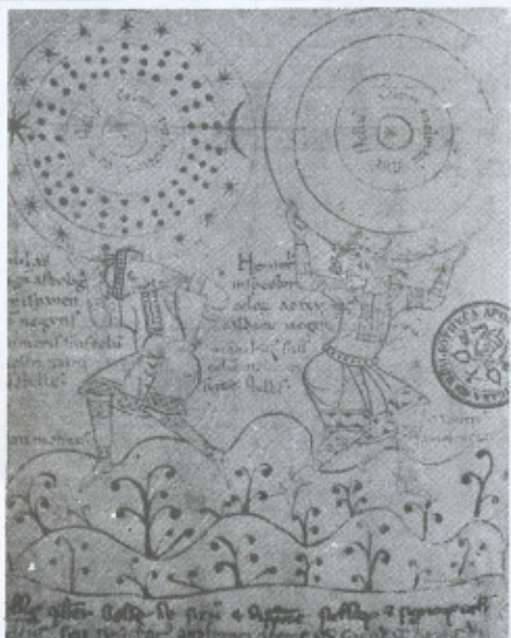
10. Atlas e Nimrod . Roma, Biblioteca do Vaticano, Cod. Pal. lat. 1417, f.º 1, ca. 1100.

los visuais que tinham diante dos olhos, quer hajam copiado diretamente um monumento clássico ou imitado uma obra mais recente derivada de um protótipo clássico através de uma série de transformações intermediárias. Os artistas que representaram Medéia como uma princesa medieval ou Júpiter como um juiz medieval traduziram em imagens uma simples descrição encontrada em fontes literárias.