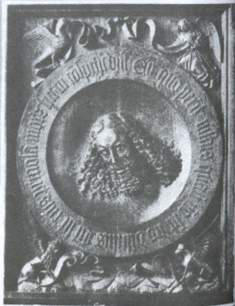
4. Cabeça de São João . Hamburgo, Museum für Kunst und Gewerbe, ca. 1500.

corrigir nossa experiência prática investigando a maneira pela qual, sob diferentes condições históricas, objetos e fatos eram expressos pelas formas, ou seja, a história dos estilos, do mesmo modo podemos suplementar e corrigir nosso conhecimento das fontes literárias, investigando o modo pelo qual, sob diferentes condições históricas, temas específicos ou conceitos eram expressos por objetos e fatos, ou seja, a história dos tipos.