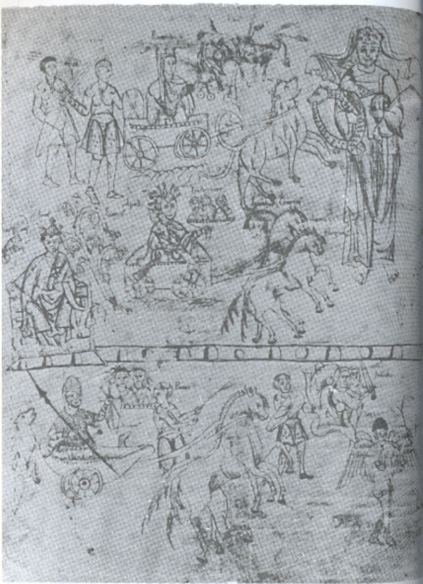
11. Os deuses pagãos. Munique, Staatsbibliothek, Clm. 14271, f o 11v., ca. 1100.

vo. Pois, mesmo quando houve uma tradição representativa em certos campos das imagens clássicas, essa tradição representativa foi deliberadamente abandonada em favor de representações de caráter inteiramente não-clássico logo que a Idade Média alcançou estilo próprio.